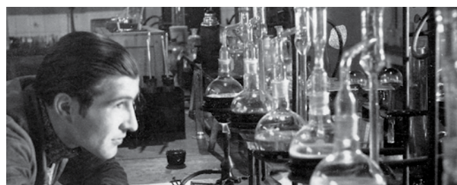
Damals wie heute – Forschung und Entwicklung gehören zu den Kernkompetenzen unseres Unternehmens.

ADDINOL bietet intelligente Lösungen, die eine optimale Schmierung sicherstellen und gleichzeitig einen verantwortungsvollen Umgang mit der Umwelt gewährleisten. Viele unserer Hochleistungs-Schmierstoffe steigern ganz entscheidend die Energieeffizienz von Anlagen und Motoren. Sie verfügen über deutlich längere Standzeiten als herkömmliche Produkte und erhöhen die Lebensdauer der geschmierten Komponenten.