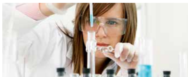
Now and then – Research and development make up a vital part of our company's core competence.